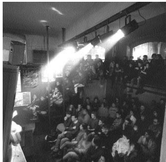
El Jazz Sí Club, un dels emblemes del Taller de Músics.

- A part de la música clàssica, hi ha una concentració excessiva. Després de l'estiu tenim el Cicle de Jazz organitzat per l'Associació de Músics de Jazz amb actuacions a l'aire lliure i en els clubs, el Cicle de Jazz a l'Auditori, el Festival de Jazz de Ciutat Vella, el Festival Internacional de Jazz de Barcelona, el col·lectiu Gràcia Territori Sonor amb el seu Festival de