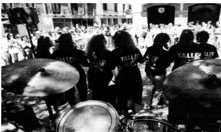
Actuació d'alumnes del Taller de Músics.